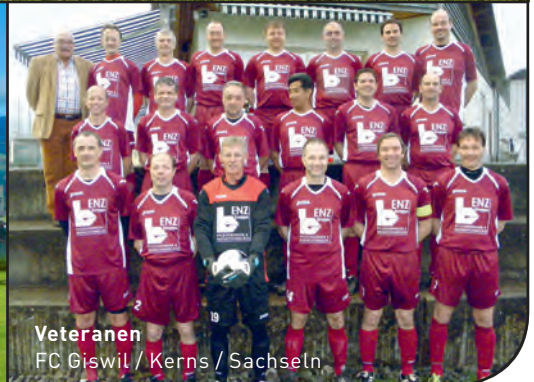
Veteranen FC Giswil / Kerns / Sachseln