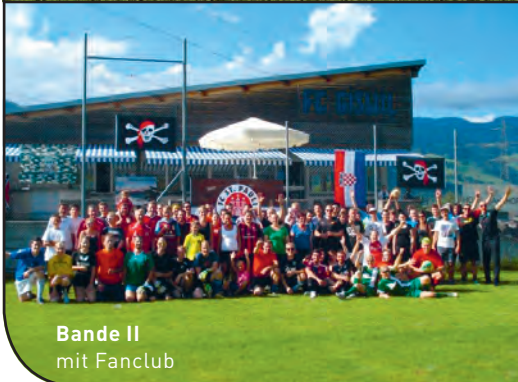
Bande II mit Fanclub