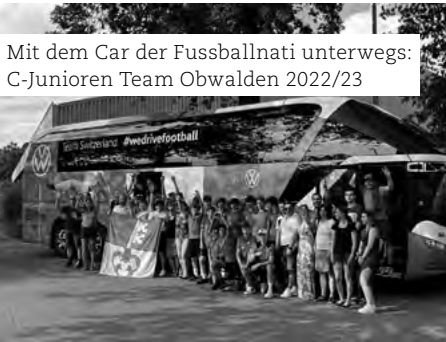
Mit dem Car der Fussballnati unterwegs: C-Junioren Team Obwalden 2022/23

Vorstand Team Obwalden Autor: Patrick Berchtold