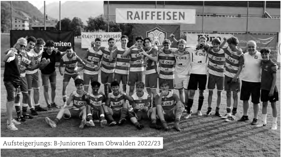
Aufsteigerjungs: B-Junioren Team Obwalden 2022/23